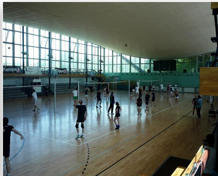
Uczestnicy wycieczki w budynku AWF