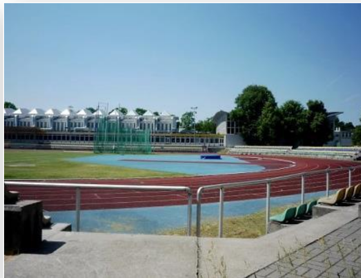
Boiska treningowe różnych dyscyplin sportowych