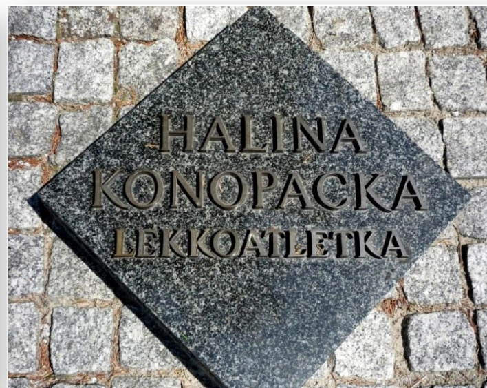
Tablice upamiętniające wybitnych sportowców na „Złotym Kręgu”