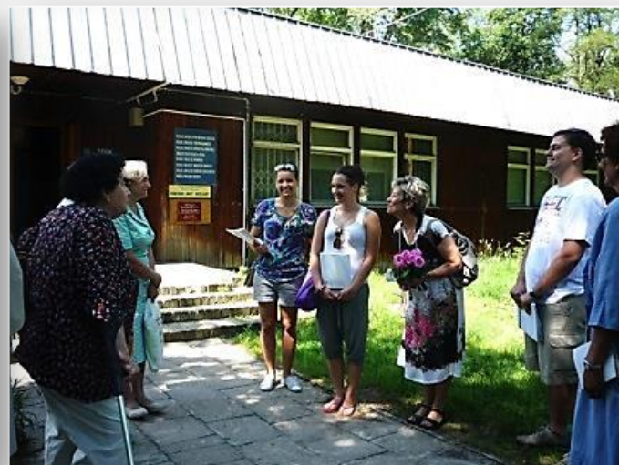
Budynki Akademii Wychowania Fizycznego Józefa Piłsudzkiego