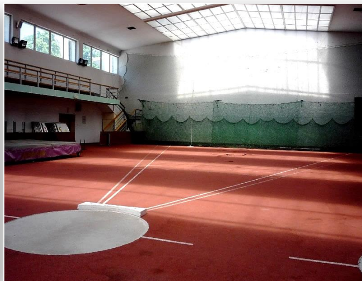
Sale gimnastyczne do ćwiczeń w dyscyplinach lekkoatletycznych