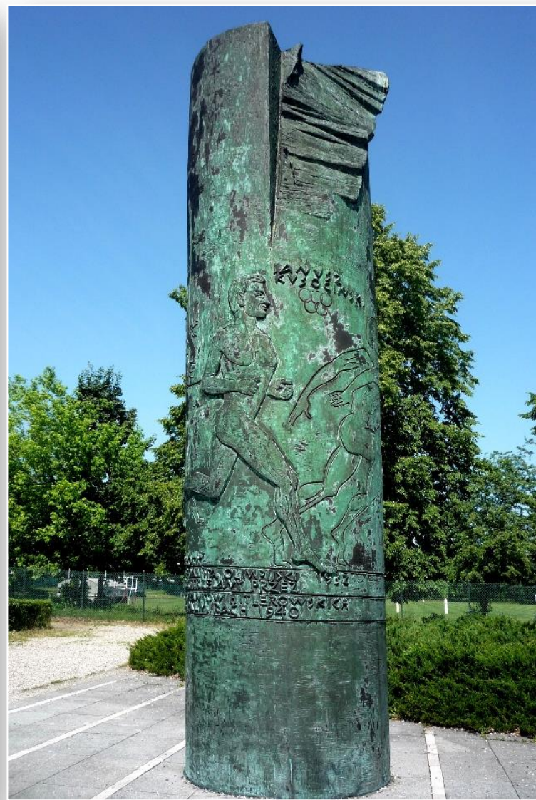
Pomnik upamiętniający olimpijczyka i wybitnego sportowca Janusza Kusocińskiego, zamordowanego przez hitlerowców w Palmirach w 1940 roku